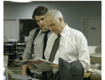
2007 RENAISSANCE D'UN CHAMPION (Resurrecting the Champ) de Rod Lurie avec Josh Harnett