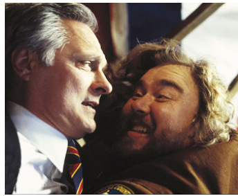
1995 CANADIAN BACON (Canadian Bacon) de Michael Moore avec John Candy