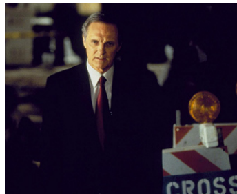
1997 MAD CITY (Mad City) de Costa-Gavras