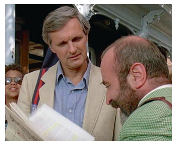
1986 SWEET LIBERTY (Sweet Liberty) d'Alan Alda avec Bob Hoskins