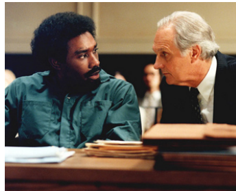
2001 THE KILLING YARD (The Killing Yard) d'Euzhan Pacey avec Benz Antoine