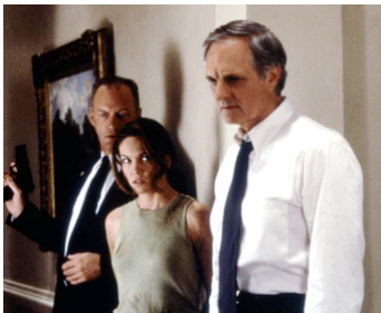
1997 MEURTRE À LA MAISON-BLANCHE (Murder at 1600) de Dwight H. Little avec Diane Lane