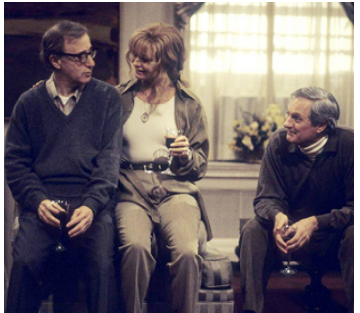
1996 TOUT LE MONDE DIT I LOVE YOU (Everyone says I love you) de Woody Allen avec Woody Allen, Goldie Hawn