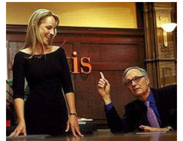
2000 CE QUE VEULENT LES FEMMES (What Women Want) de Nancy Meyers avec Helen Hunt