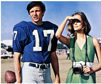
1968 LE LION DE PAPIER (Paper Lion) d'Alex March avec Lauren Hutton