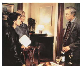
1992 INTIMES CONFESSIONS (Whispers in the Dark) de C. Crowe avec Annabella Sciorra