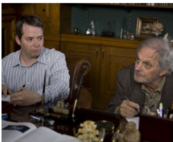
2008 DIMINISHED CAPACITY de Terry Kinney avec Matthew Broderick