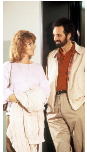
1989 A NEW LIFE (A New Life) d'Alan Alda avec Ann-Margret