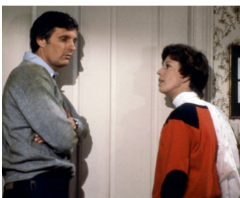
1981 LES QUATRE SAISONS (The Four Seasons) d'Alan Alda avec Carol Burnett