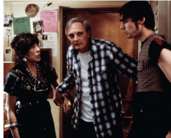
1996 FLIRTER AVEC LES EMBROUILLES (Flirting with Disaster) de David O. Russell avec L. Tomlin