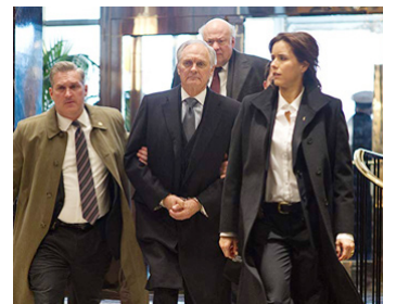
2011 LE CASSE DE CENTRAL PARK (Tower Heist) de Brett Ratner avec Tea Leoni