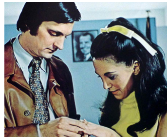
1970 JENNY (Jenny) de George Bloomfield avec Marlo Thomas