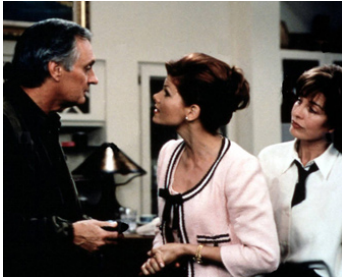
1996 JAKE'S WOMEN (Jake's Women) de Glenn Jordan avec Lolita Davidovich, Anne Archer