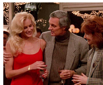
1989 CRIMES ET DÉLITS (Crimes and Misdemeanors) de W. Allen avec D. Hannah, Joanna Gleason