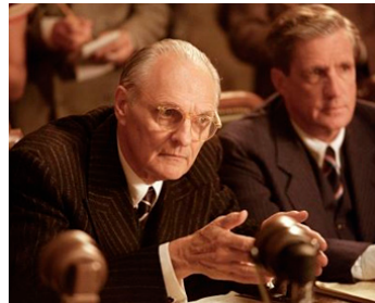
2004 AVIATOR (The Aviator) de Martin Scorsese avec Terry Haig