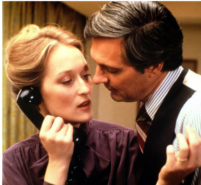
1979 LA VIE PRIVÉE D'UN SÉNATEUR (The Seduction of Joe Tyhan) de J. Schatzberg avec Meryl Streep