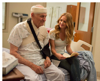
2015 CHEMINS CROISÉS (The longest Ride) de George Tillman Jr avec Britt Robertson