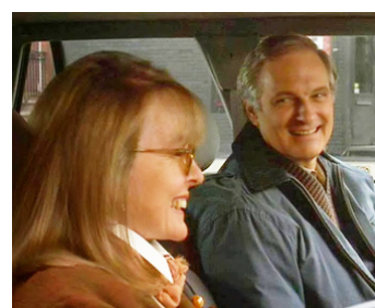
1993 MEURTRE MYSTÉRIEUX À MANHATTAN de Woody Allen avec Diane Keaton