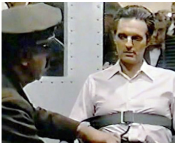
1977 CELLULE DES CONDAMNÉS (Kill me if you can) de Buzz Kulik