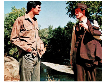
1970 LA GUERRE DES BOOTLEGGERS (The Moonshine War) de R. Quine avec P. McGeehan