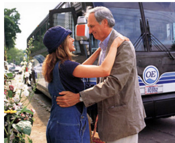
1998 L'OBJET DE MON AFFECTION (The Object of my affection) de N. Hytner avec Jennifer Aniston