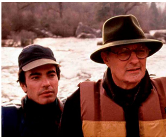
1994 LES RAPIDES DE LA MORT (White Mile) de Robert Butler avec Peter Gallagher