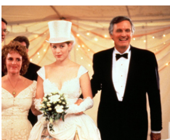
1990 BETSY'S WEDDING d'Alan Alda avec Molly Ringwald