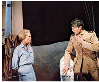
1969 THE EXTRAORDINARY SEAMAN de John Frankenheimer avec Faye Dunaway