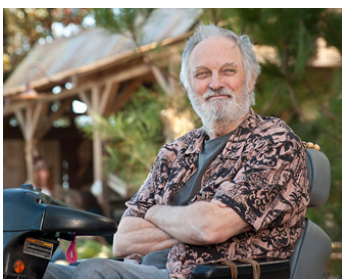
2012 PEACE, LOVE ET PLUS SI AFFINITÉS (Wanderlust) de David Wain