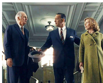
2015 LE PONT DES ESPIONS (Bridge of Spies) de S. Spielberg avec Tom Hanks, Amy Ryan