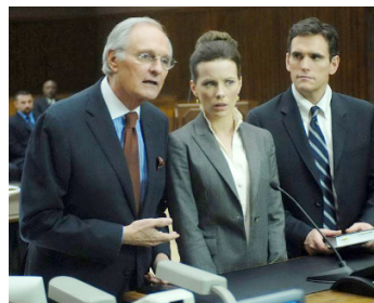
2008 LE PRIX DU SILENCE (Nothing but the Truth) de Rod Lurie avec K. Beckinsale, Matt Dillon