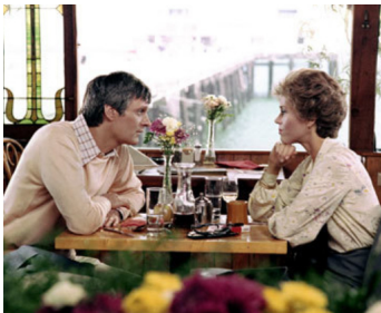
1978 CALIFORNIA HÔTEL (California Suite) d'Herbert Ross avec Jane Fonda