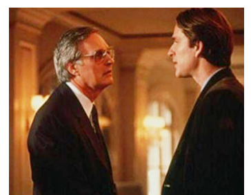
1993 LES SOLDATS DE L'ESPÉRANCE (And the Band played on) de R. Spottiswoode avec Matthew Modine