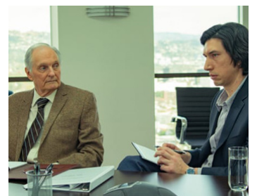
2019 MARRIAGE STORY de Noah Baumbach avec Adam Driver