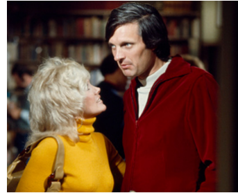
1972 PLAYMATES (Playmates) de Theodore J. Flicker avec Connie Stevens