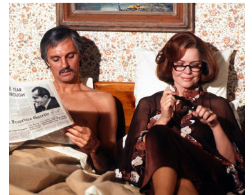
1978 MÊME HEURE L'ANNÉE PROCHAINE (Same Time, Next Year) de R. Mulligan avec E. Burnstyn